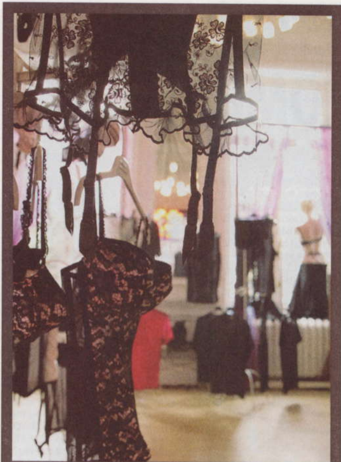
■ Rideau de dentelles

◉ www.delicatescence.be , place Saint-Barthélemy, 5.